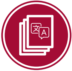
五种语言的相关文化 媒体广告*