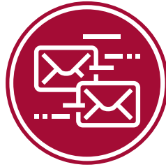
社区合作伙伴参与