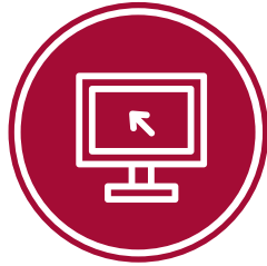
五种语言的多语言 在线开放日*