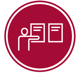
在当地商家张贴 传单